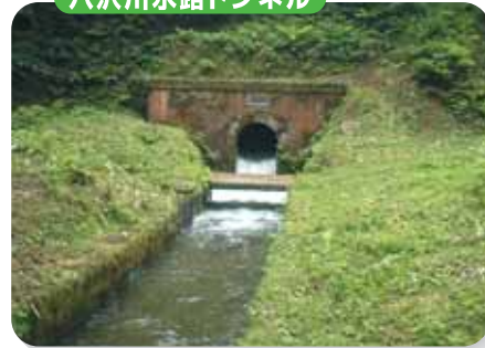
八沢川水路トンネル