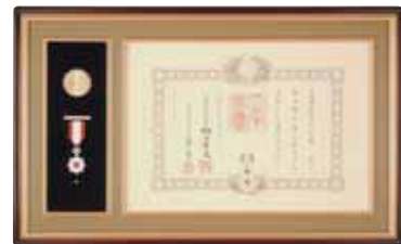
◆旭日双光章（平成19年11月受章）