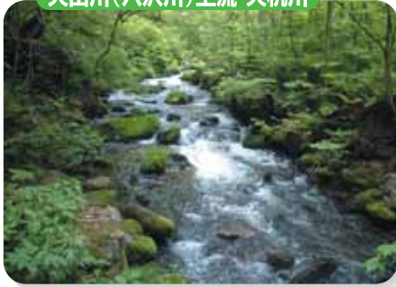
大山川(八沢川)上流 大机川