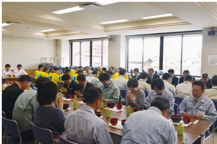
収穫感謝祭 会食の様子

当日は天候に恵まれ絶好の餅つき日和となり、杵が振り下ろされる度に大きな歓声が上がっていました。