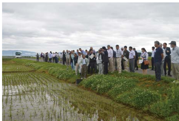
県営広野地区農業水利施設保全合理化事業