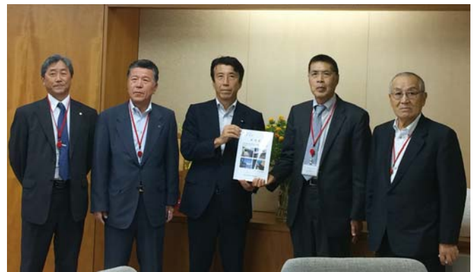
H29.7.26 農林水産省 斎藤農林水産副大臣(現大臣)と面談