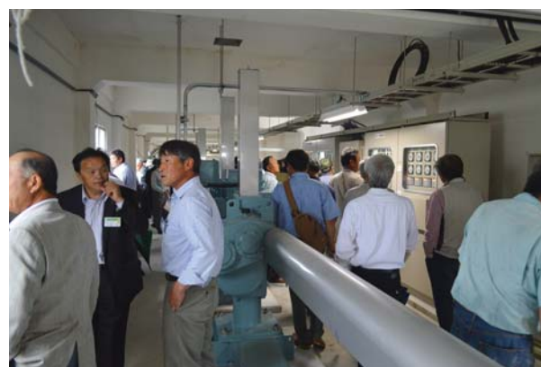
赤川頭首工（取水門操作室）