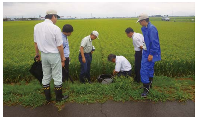
茨城県 県央農林事務所土地改良部門の皆さん (県営広野地区農業水利施設保全合理化事業)