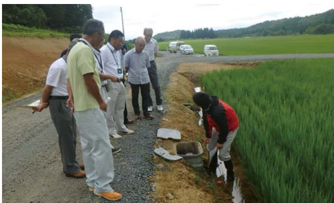
野川土地改良区 山王原地区施工委員会の皆さん (県営たらのきだ地区経営体育成基盤整備事業・天狗森団地)