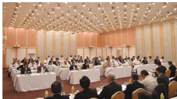
臨時総代会の様子