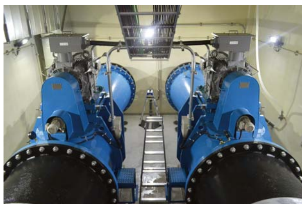
発電所内部の様子（発電機）