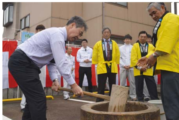
山形県庄内総合支庁 産業経済部 山平農林技監